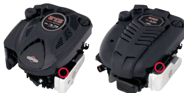
600 Series™, 800 Series™ Quantum®, Intek™