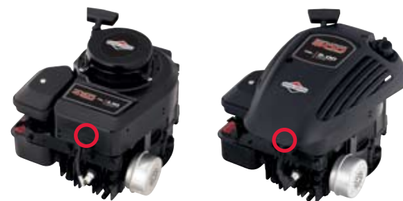
400 Series™, 500 Series™ Classic™, Sprint™, SO™, Q™

○ Sulla lastra in metallo sopra alla marmitta